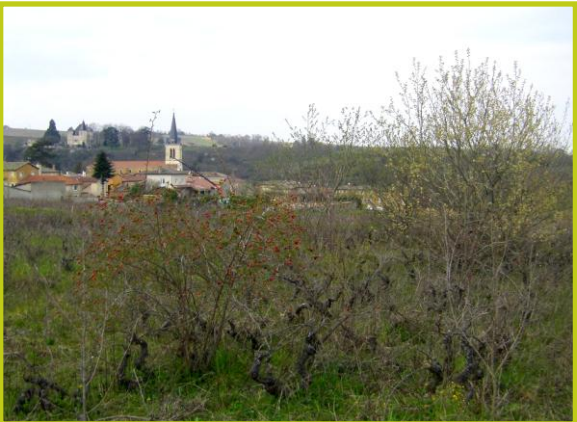
Friche à Denicé où la pression foncière freine l'activité agricole

Dans le Beaujolais, les friches atteignent rapidement un stade arbustif puis arboré.