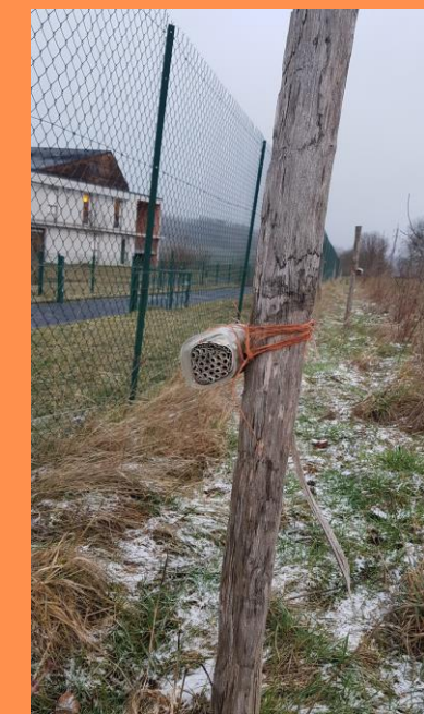
Nicheur à pollinisateurs Source personnelle

Travail de recherche participative avec l'OAB