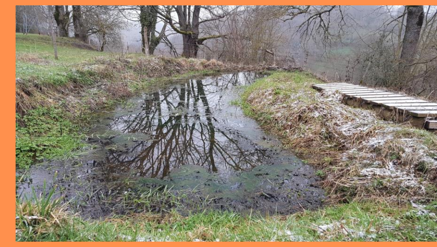
L'une des deux mares

Deux mares et des abreuvoirs (réhabilitation des berges) comme réserve de biodiversité