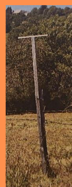
Perchoir à rapaces