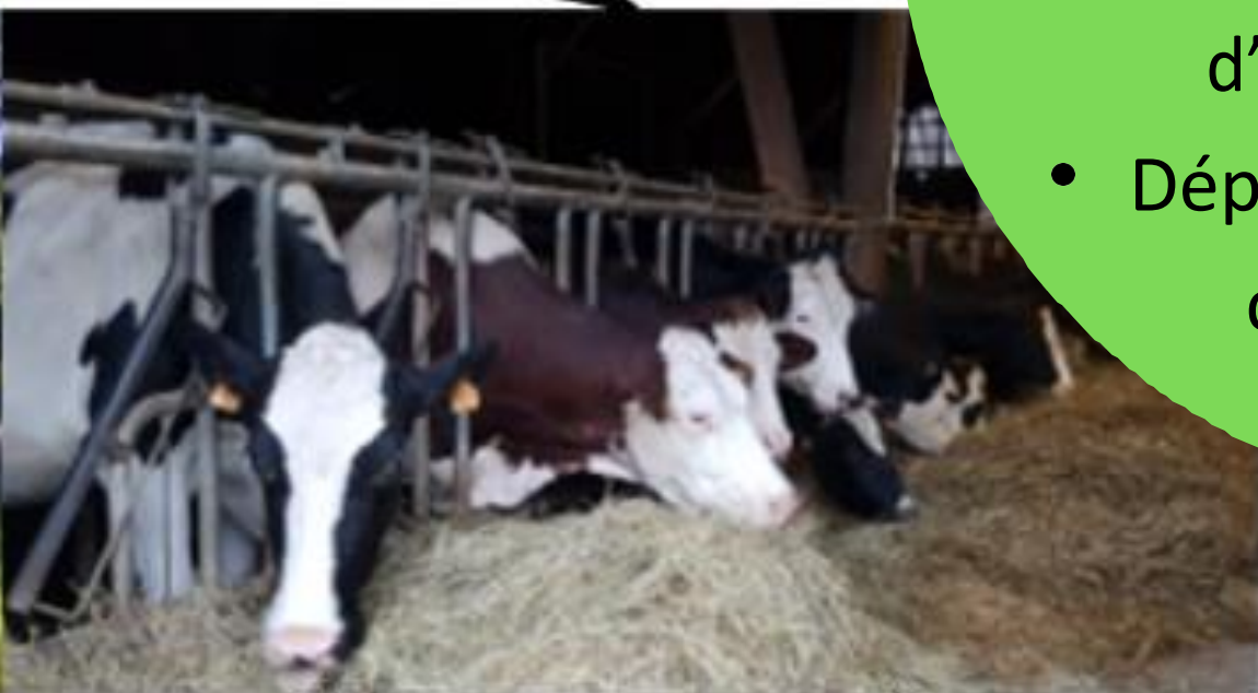
Troupeau laitier