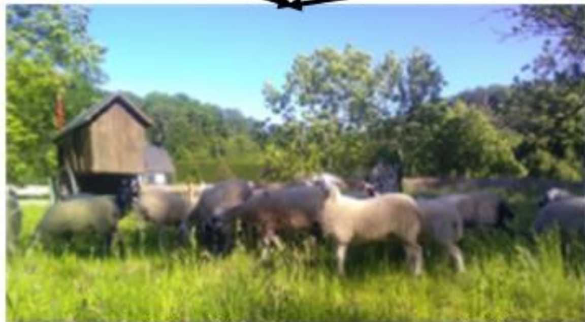
Troupeau de brebis

110 ha de prairies permanentes 2 sites : Le Marchédial et Prades